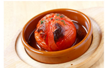
丸ごとトマトの石窯焼き

「トマトの石窯焼き(¥400)」や「丸ごとトマトのポモドーロスパゲッティ(¥980)」、「トマトのエビチリ窯焼き(¥780)」、「生絞リトマトジュース(¥450)」など…魅惑的な料理が並びます。