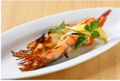
特大海老の500度焼き